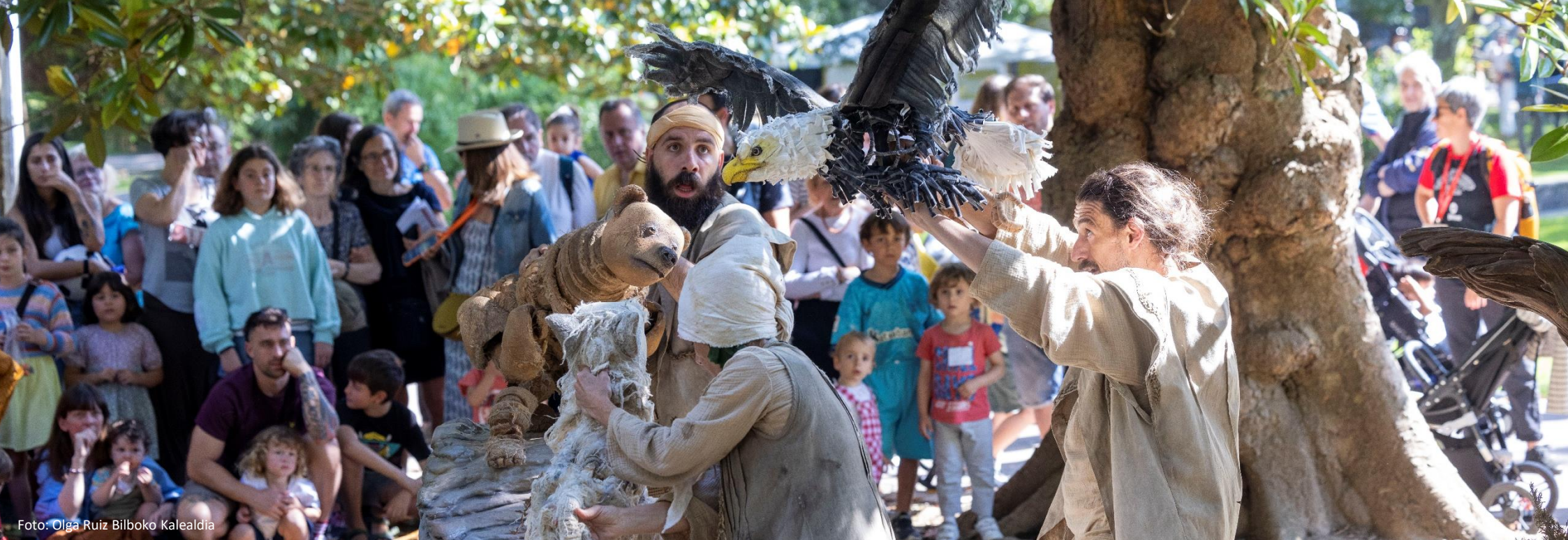
Bilboko Kalealdia