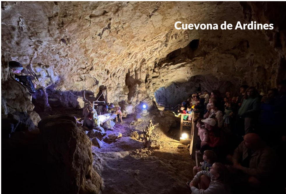
Cuevona de Ardines