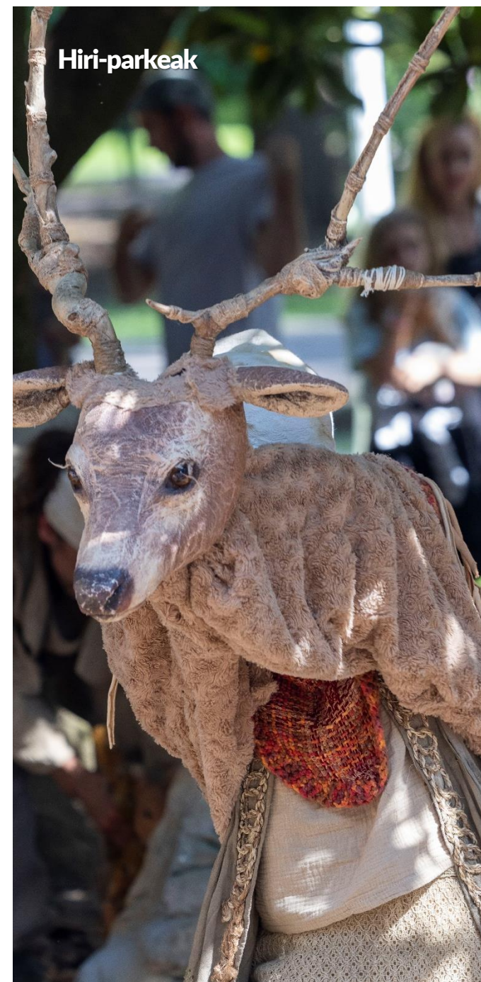
Bilboko Kalealdia