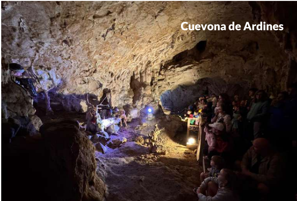
Cuevona de Ardines