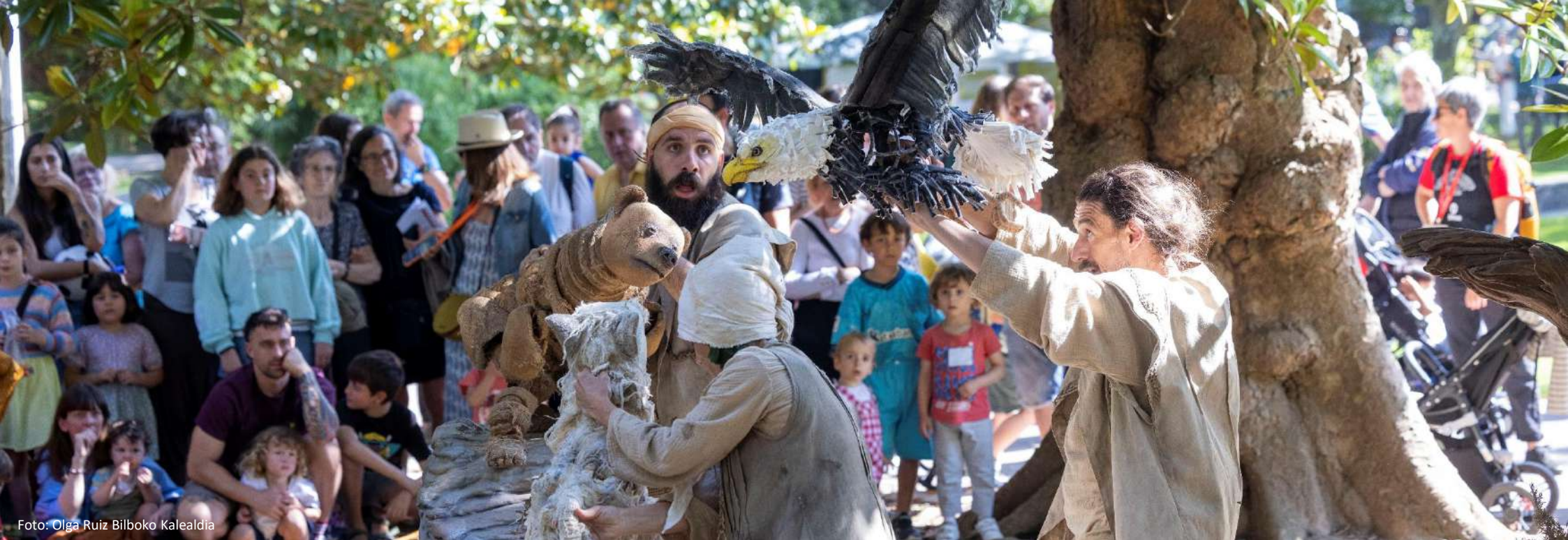
Bilboko Kalealdia